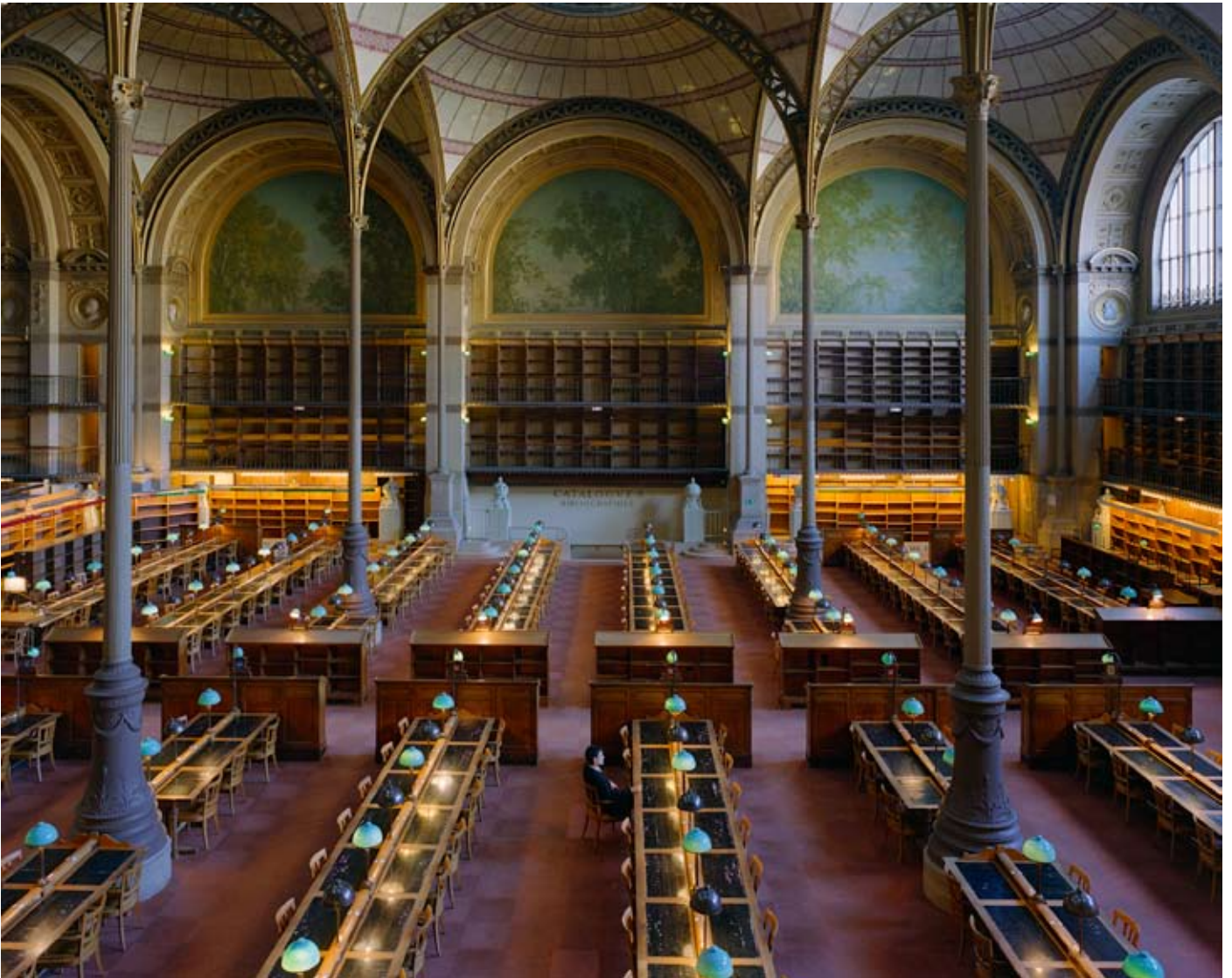
"Toute la mémoire du monde - BNF II" photographies couleurs 124 x 150 cm encadré, 3 tirages 2006

Toute la mémoire du monde / Alles Wissen dieser Welt