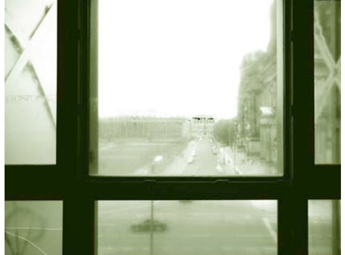
→ »WEISSBEREICH« DIE BEIDEN LOOPS MIT INNENBLICK UND FENSTERBLICK DES PALASTS DER REPUBLIK, LEIPZIG/BERLIN 2001.

Palast. Die Kamera schwebt langsam um den entkernten, asbestfreien und deshalb auf der Baustelle »Weißbereich« genannten Volkshausaal herum und nimmt einmal den Blick aus den trüben Fenstern, einmal auf den leeren Innenraum in einer kontinuierlichen Fahrt auf. Das Filmmaterial ähnelt den Videos zur Bauüberwachung auf Baustellen, die zwei Ansichten werden als Loops parallel projiziert. Mit dem Palast beschäftigt sich das Berliner Künstlerpaar bisher am ausführlichsten. 2001 beginnen die Recherchen zum Palast, der im Namen der Zukunft als Vergangenes beseitigt werden soll – Rohbau, Zwischennutzung, Rückbau, das Ende im Anfang. Eine Art Bestandsaufnahme liefert neben den Film-