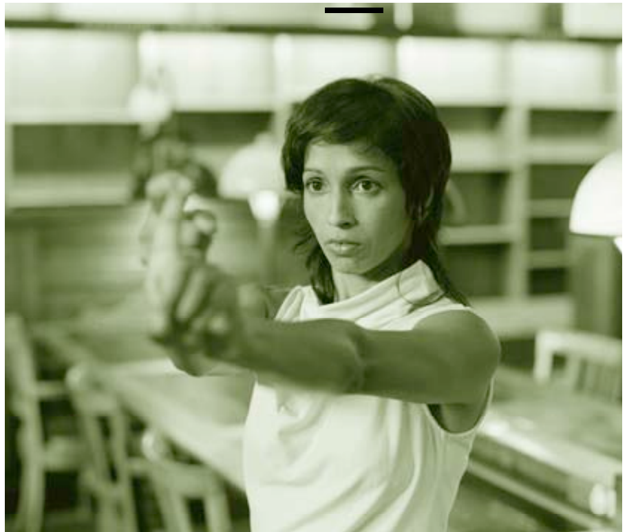
→ »TOUTE LA MÉMOIRE DU MONDE – ALLES WISSEN DIESER WELT«, GEZEIGT IM FRÜHJAHR 2006 IN DER GALERIE EIGEN + ART BERLIN.